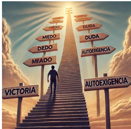
La superación de miedos internos